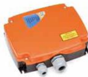
>>> Receptor R70MR11